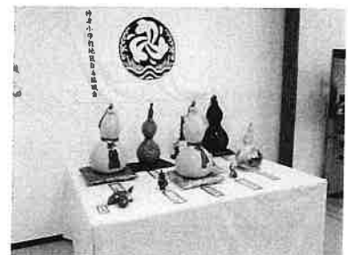
1月 ひょうたん作品展