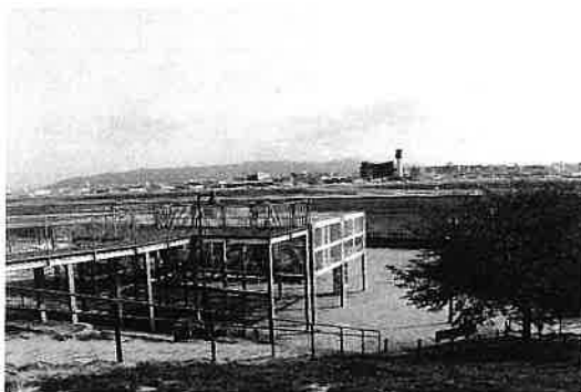
伊丹スカイパーク