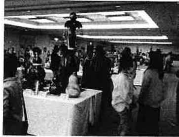
6月 ひょうたん研修会