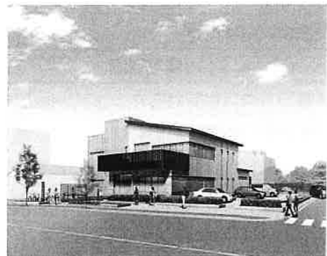
神津交流センター